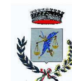
Comune di Viano