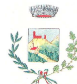
Comune di Baiso

E' STATA PRESENTATA RICHIESTA DI FINANZIAMENTO ALLA FONDAZIONE PIETRO MANODORI